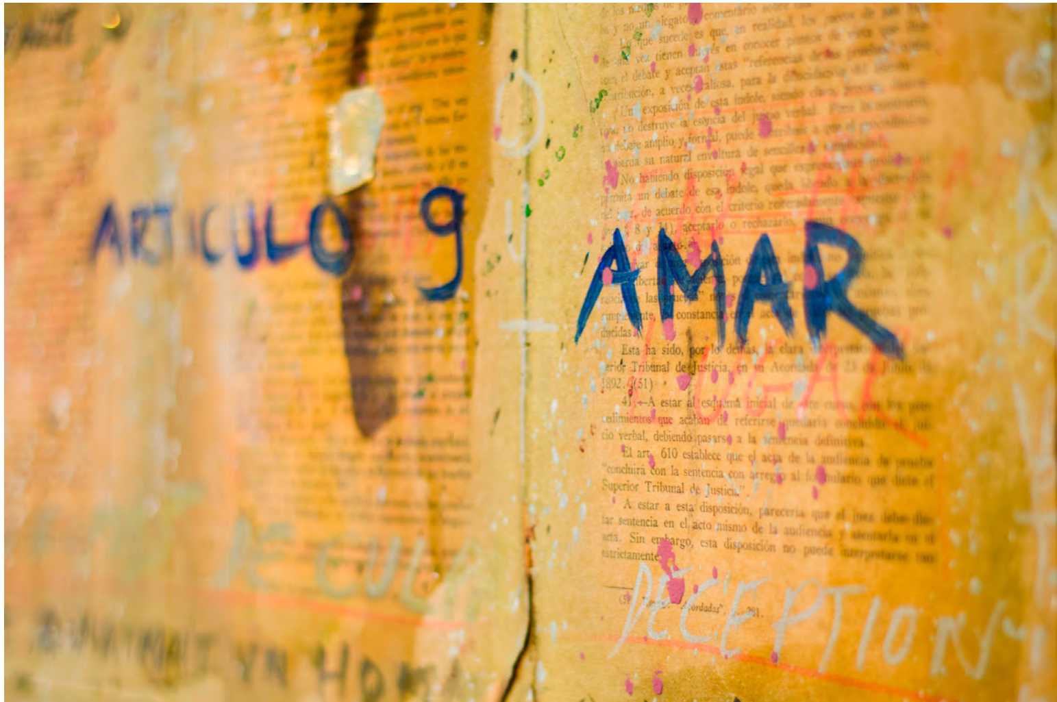
Article 9, “Aimer” (détail), collage, 50x70 cm | 2015