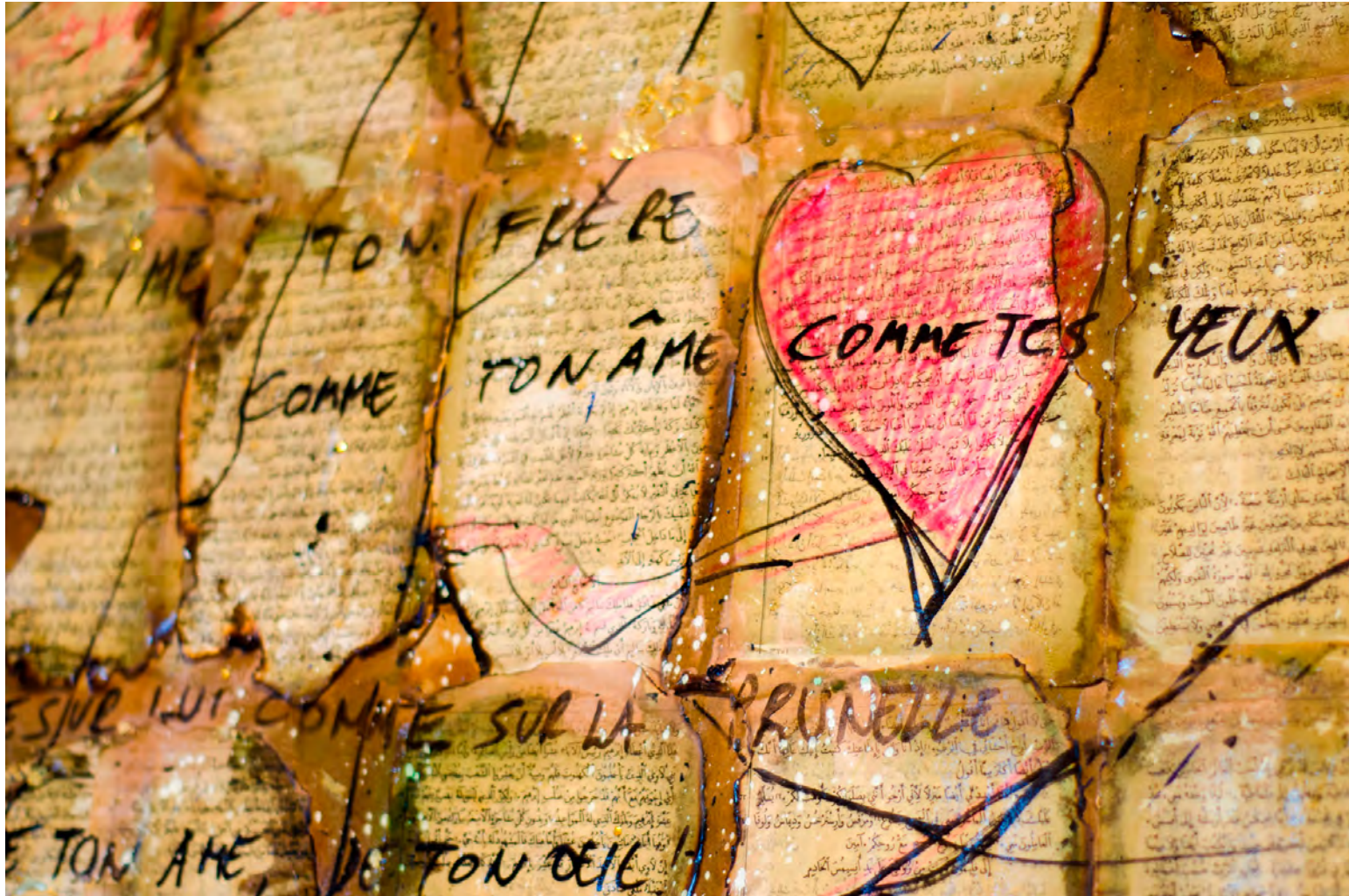
Vous ne pouvez pas être juge et partie (détail) , collage, 50x70 cm | 2015