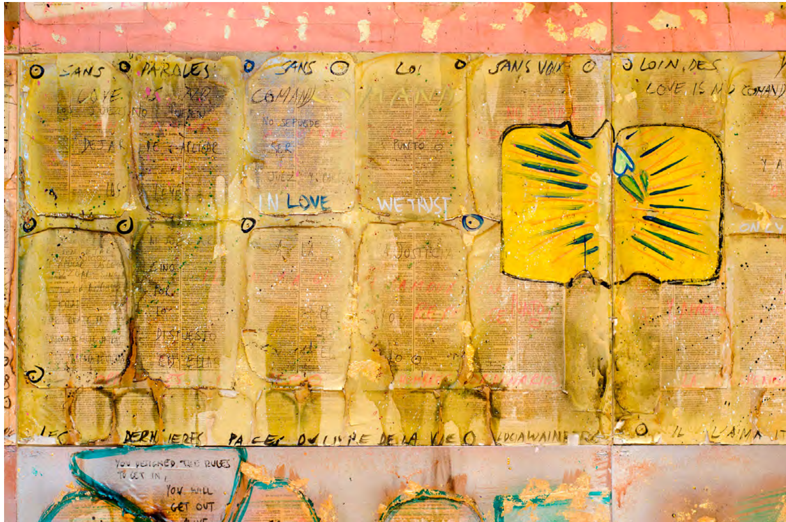
“In love we trust” (détail), collage, 50x70 cm | 2015