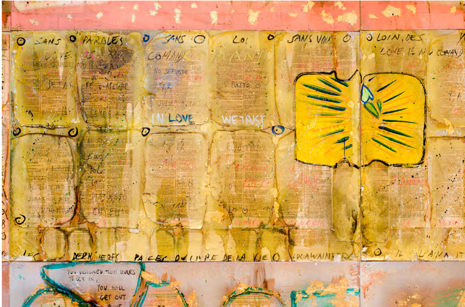
“En el amor confiamos” (detalle), collage, 50x70 cm | 2015