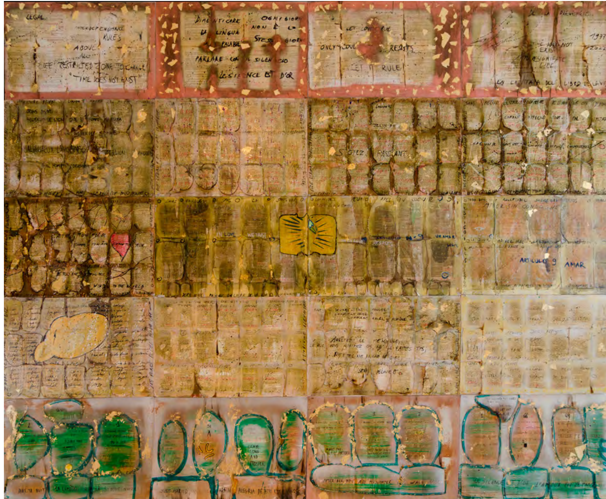
No se puede ser juez y jurado , collage mixto, 70 cartones grises de 50x70 cm | 2015